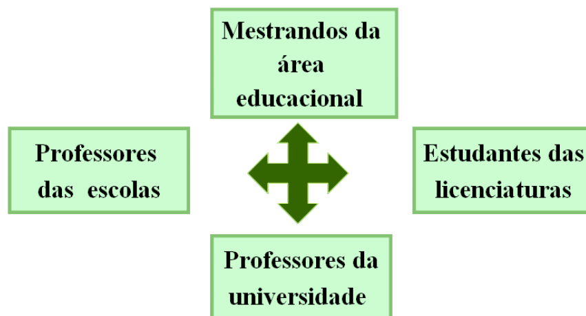
Figura 1: inter-relações de sujeitos em coletivo organizado

Criar núcleos de estudo e pesquisa, envolvendo professores de escola e formadores de professores, além de estudantes de licenciaturas e de pós-graduação das áreas de educação e ensino, com vistas à melhora da educação científica em todos os níveis, vem sendo defendido como princípio em muitos fóruns educacionais, como se pode ver em memórias desses eventos nos últimos anos. Aceitando esse princípio e buscando desenvolvê-lo na prática, participantes do Gipec-Unijuí vêm produzindo e divulgando trabalhos com vistas a contribuir no debate sobre essa modalidade de desenvolver currículos escolares mais consistentes para as necessidades atuais dos estudantes. O Gipec é um grupo interdepartamental e interdisciplinar de pesquisa e desenvolvimento sobre novas práticas curriculares e modalidades de formação de professores, que busca privilegiar interações assimétricas entre a diversidade de sujeitos participantes do grupo, conforme expresso na Figura 1. As assimetrias se dão em níveis diferentes de compreensão de determinada prática ou teoria e elas estão ora com um grupo de sujeitos, ora com outro.