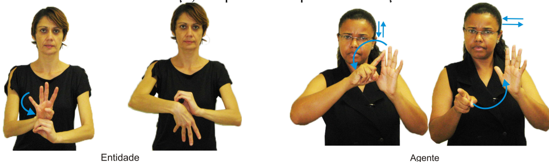
Figura 2. Imagens de sinais criados para os primitivos de modelagem.

O grupo de estudo elaborou um glossário em Libras constituído de 32 termos utilizados em modelos qualitativos: inteligência artificial, raciocínio qualitativo, modelos qualitativo, fragmento de modelo, sistema, entidade, propriedades, quantidades (variáveis), magnitude, derivadas, valores qualitativos, espaço quantitativo, configuração, processos, influência, taxa, influência direta I +, influência direta I-, proporcionalidade qualitativa P +, proporcionalidade qualitativa P-, correspondência Q, correspondência V, pressuposto, agente, cenário, estado qualitativo, grafo de estado, trajetória, comportamento do sistema, diagrama de valores, modelo causal e a expressão rodar a simulação. Os recursos gráficos utilizados para transcrever sinais em Português foram tomados a partir de (QUADROS E KARNOPP, 2004). Exemplos são apresentados na Figura 2, as setas expressando os movimentos das mãos e da cabeça, são parâmetros para constituição do termo em Libras.