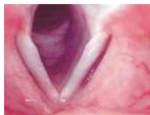
Figura 2 - Laringe e Pregas vocais (Tomiyama, 2009).

Para que a voz seja produzida, o ar que foi inspirado e está armazenado nos pulmões é expelido pelo músculo diafragma. Este ar expelido passa com uma grande pressão pela traquéia, e depois pela laringe, onde estão situadas as pregas vocais, que são duas dobras na parede da laringe constituídas por muitas pequenas tiras de músculos, controladas separadamente por fibras nervosas diferentes (Okuno, 1982).