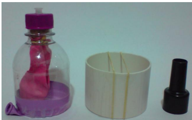
Figura 3 – Objetos utilizados na atividade.