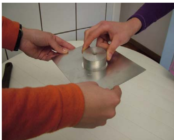
Figura 2. Imagem estática coletada de um episódio do segundo filme em que os alunos são questionados sobre o que acontece com o cilindro em relação ao orifício da placa quando sua temperatura é aumentada para cerca de 245°C e não mais atravessa o orifício da placa que se encontra à temperatura ambiente.