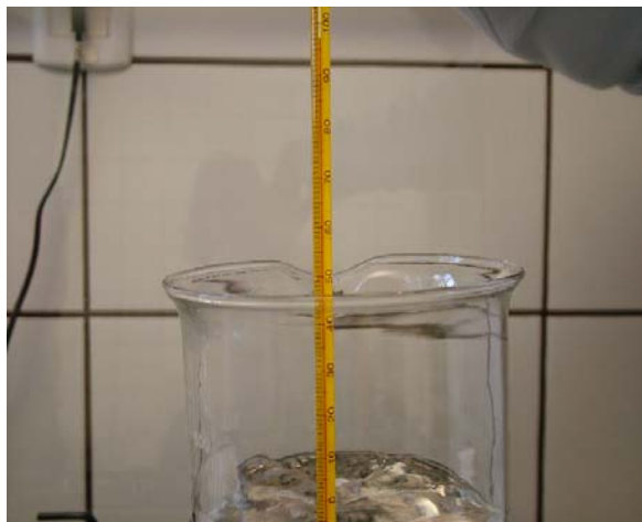
Figura 3. Imagem estática coletada de um episódio do terceiro filme em que os alunos são questionados sobre o que acontece com a coluna do líquido do termômetro durante um processo de aumento de temperatura da água até sua ebulição.

do termômetro podem emergir, enquanto se observa o aumento da temperatura da água. A questão que se colocou para os alunos é o que acontece com a coluna do líquido do termômetro enquanto o processo ocorre. Durante a ebulição, espera-se que o aluno observe que não ocorre variação na altura da coluna de líquido.