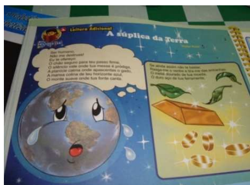
FIGURA 3: Materiais consultados (c).

Tomou-se o cuidado para que os textos escolhidos estivessem de acordo com as Diretrizes Curriculares de Ciências para a Educação Básica (2006) e que apresentassem questões emergentes e atuais da sociedade.