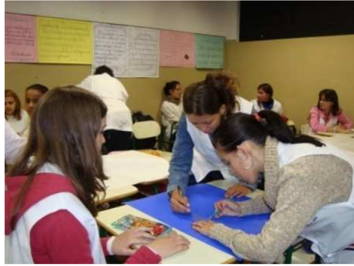
FIGURA 5: Compartilhando idéias e construindo o portfólio (b).