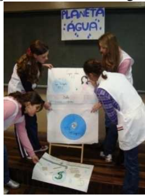
FIGURA 7: Apresentando o portfólio (a)

Portanto, à medida que as alunas iam construindo o portfólio havia um trabalho contínuo de avaliação e auto-avaliação entre elas. As figuras 7, 8 e 9 ilustram esse momento.