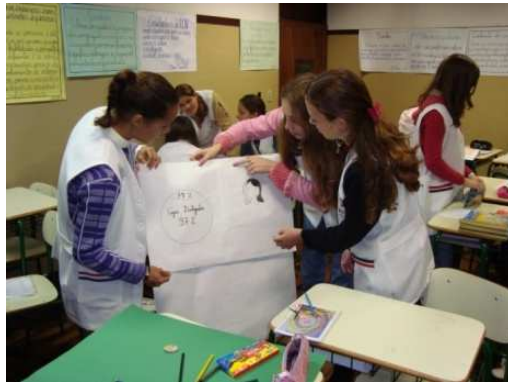
FIGURA 6: Compartilhando idéias e construindo o portfólio (c).

Portanto, à medida que as alunas iam construindo o portfólio havia um trabalho contínuo de avaliação e auto-avaliação entre elas. As figuras 7, 8 e 9 ilustram esse momento.