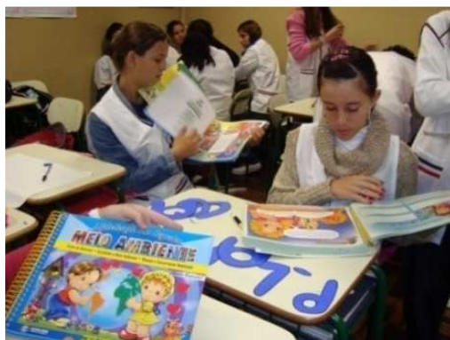
FIGURA 1: Materiais consultados (a).