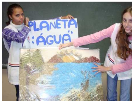
FIGURA 9: Apresentando o portfólio (c)

Ao final dessa atividade, as alunas compreenderam que a utilização do portfólio , possibilitou uma nova compreensão de como pode se realizar o processo de ensino-aprendizagem e avaliação dentro de uma perspectiva de construção, de criação, de compartilhamento de idéias e informações. Abaixo seguem alguns depoimentos dos grupos afirmando esse fato.