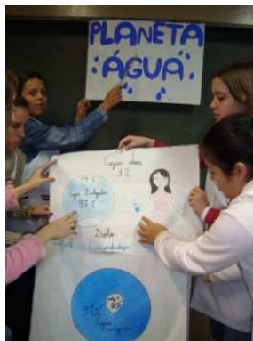
FIGURA 8: Apresentando o portfólio (b)