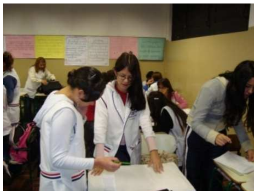
FIGURA 4: Compartilhando idéias e construindo o portfólio (a).

No momento da construção do portfólio , foi possível observar um compartilhamento de idéias, o auxílio mútuo e as interações entre as alunas. As figuras 4, 5 e 6 ilustram esse momento.