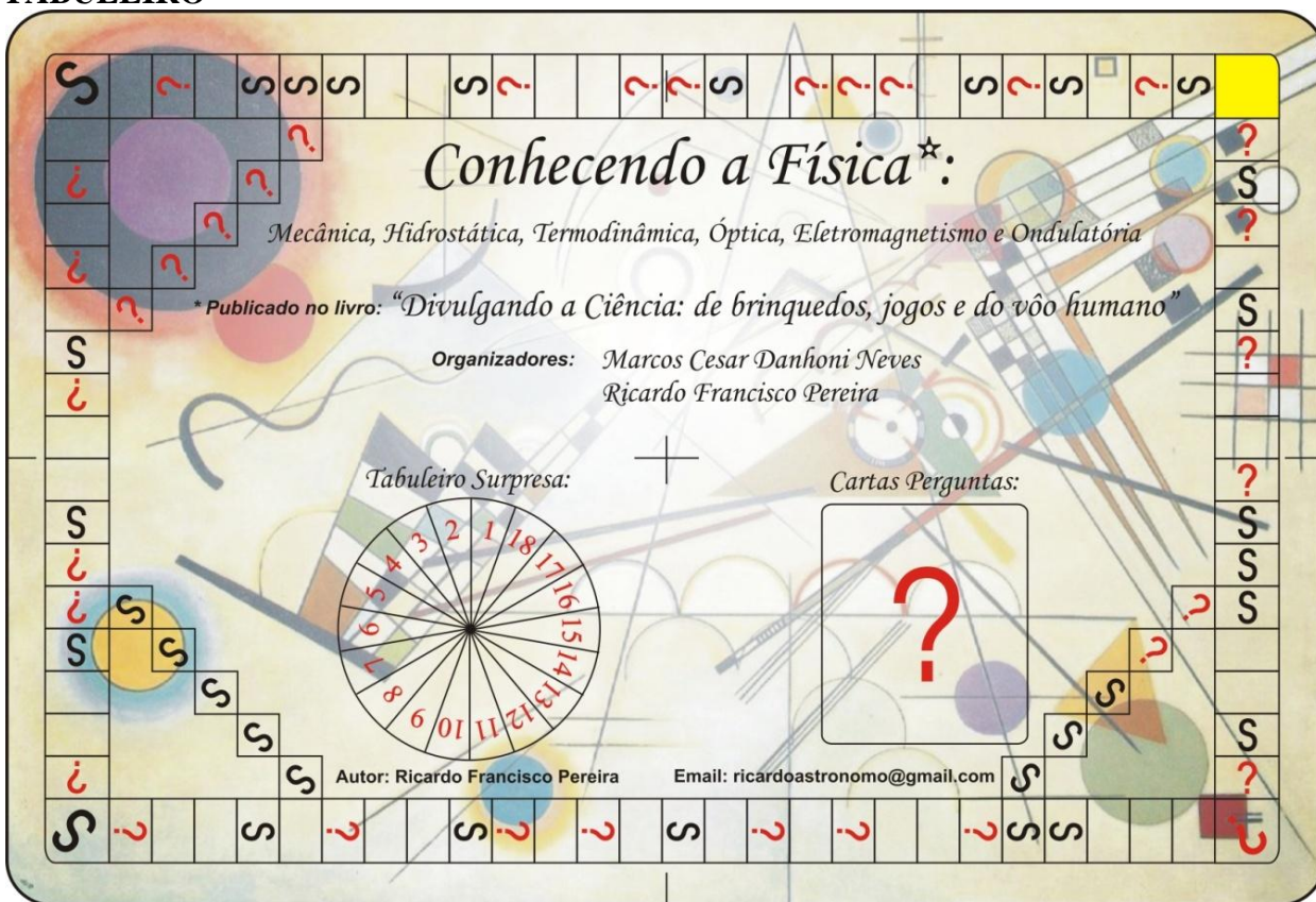
Figura 1: Tabuleiro em tamanho reduzido (o tamanho real é de 4 folhas de papel A4).