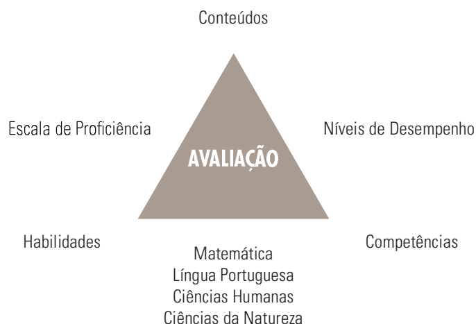
Figura 1. Relações entre habilidades, conteúdos e competências avaliadas e expressas nos níveis de desempenho da Escala de Proficiência do SARESP nas disciplinas de Matemática, Língua Portuguesa, Ciências da Natureza e Ciências Humanas.

Os vértices da Figura 1 contêm os três aspectos fundamentais da Matriz. Ela se refere à verificação de conteúdos disciplinares, por intermédio da utilização de habilidades, graças às quais se poderá inferir o grau de proficiência das competências cognitivas desenvolvidas pelos alunos em seu processo de escolarização. A avaliação de competências, por intermédio destes dois indicadores (habilidades associadas a conteúdos em uma situação de prova) justifica-se pelo compromisso assumido no currículo, em fase de implementação, das escolas públicas do Estado de São Paulo. Trata-se do propósito de caracterizar a missão da escola, entendida como um lugar e um tempo em que competências fundamentais ao conhecimento humano são aprendidas e valorizadas. Essas competências expressam a função emancipadora da escola, ao assumir que dominar competências é uma forma de garantir que houve aprendizagem efetiva dos alunos.