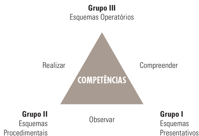
Figura 2. Grupos de competências avaliadas nas provas do SARESP e as funções (observar, realizar e compreender) valorizadas.

Na Figura 2, a seguir, apresentamos uma síntese das competências cognitivas avaliadas no exame do Saresp.