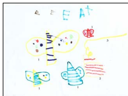
Fig. 2: Alê 1- borboletas; 2-casulo; 3-árvore