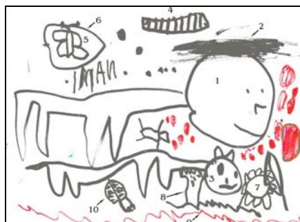
Fig. 4: Alex 1-leão; 2-juba; 3-gato 4-taturana; 5- borboleta; 6-casulo; 7-flor; 8-árvore; 9-mato; 10- joaninha; 11- bolinhas