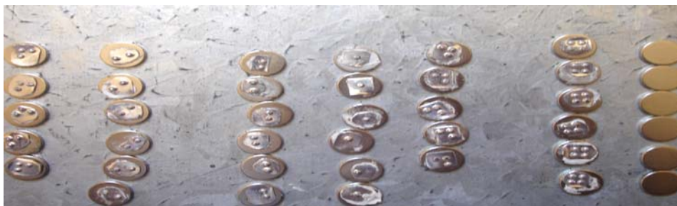
Foto 3: Símbolos separados para uso em equação

A montagem mostrada na foto 3 é feita a partir da colagem entre um ímã e um pedaço recortado de uma placa de alumínio com caracteres em Braille (Fotos 4).