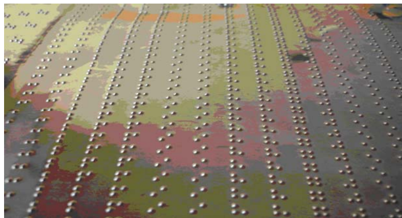
Foto 5: Placa de alumínio inteira com caracteres em Braille para recorte

Embora o recorte da placa de alumínio (foto 5) ainda inteira seja trabalhosa para não resultar em material cortante, a durabilidade é indefinida mesmo se utilizado por alunos com “um pouco mais de força na mão”(os meninos, ao apertar as primeiras peças feitas em papel espesso, apagavam os caracteres em Braille).