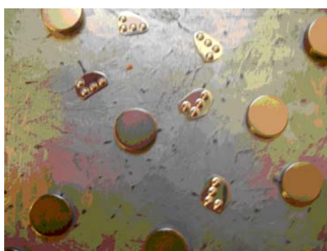
Foto 4: Ímãs e recortes de alumínio ainda não colados sobre a placa ferromagnética

A montagem mostrada na foto 3 é feita a partir da colagem entre um ímã e um pedaço recortado de uma placa de alumínio com caracteres em Braille (Fotos 4).