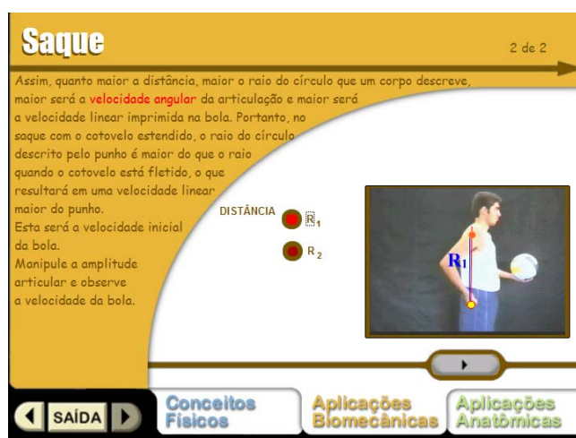
Figura 2 – Página “Saque”.

Nesse episódio, o diálogo ocorreu entre duas alunas de licenciatura que cursam a disciplina de Cinesiologia. Depois de acessarem os conceitos físicos, a dupla passou para o índice de aplicações biomecânicas acessando a página “Saque” (Figura 2). A aluna A manipula o mouse.