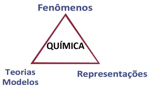
Figura 3. Formas de Abordagem da Química (Extraído do Currículo Básico Comum de Química – SEEMG, 2008, p.17)

Entre os fenômenos de interesse da Química, que fazem parte dos conteúdos curriculares, há aqueles que são visíveis ou diretamente observáveis e outros que só podem ser detectados com o uso de aparelhos. Alguns exemplos de fenômenos observáveis são as mudanças de estado físico e as transformações químicas, cujas evidências podem ser observadas, por meio dos nossos sentidos ou mudanças na aparência dos sistemas, incluindo a liberação e a absorção de calor e a emissão de luz visível. Alguns fenômenos requerem observação indireta, envolvendo a emissão de radiações invisíveis, tais como os raios-x, os raios gama, as micro-ondas, entre outros.