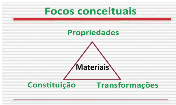
Figura 2. Focos de interesse da Química (Extraído do Currículo Básico Comum de Química – SEEMG – 2008, p.16)

professor crie oportunidades, nas quais ele possa comparar as suas ideias com as dos colegas, do livro didático, da ciência. Assim, a linguagem desempenha um papel fundamental na construção do conhecimento.