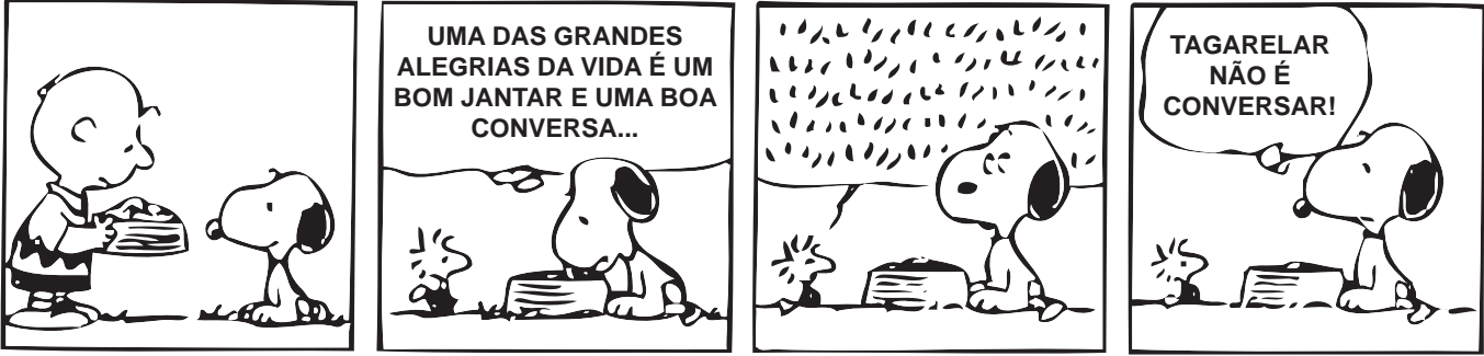
SCHULZ, C. Felicidade é... Porto Alegre: L&PM, 2014.

Os sinais gráficos e a expressão do cachorro no terceiro e no quarto quadrinhos demonstram que o personagem está