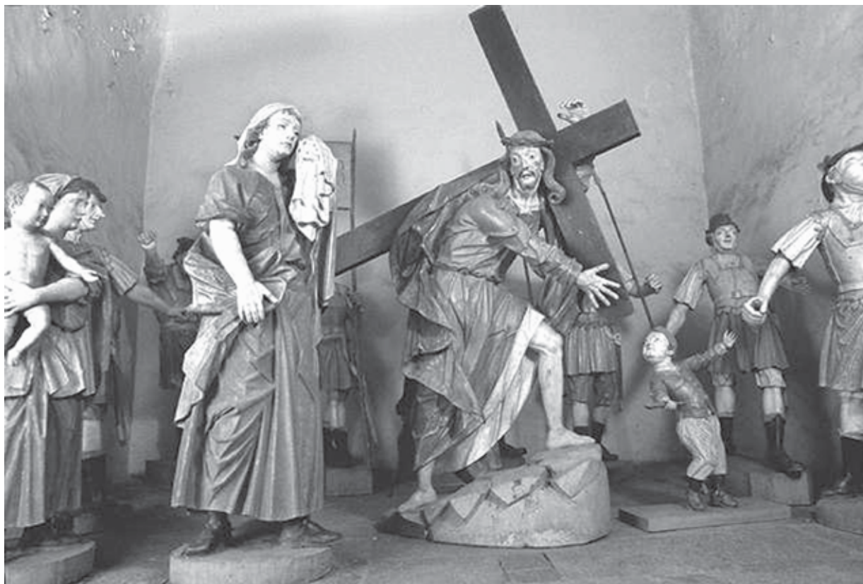
ALEIJADINHO. O carregamento da cruz (O salvador carregando o madeiro) .

Santuário do Bom Jesus de Matosinhos, Congonhas (MG), 1796-1799.