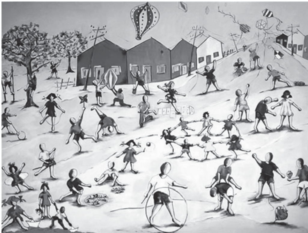
CRUZ, I. Crianças na praça. Acrílico sobre tela, 1,30 x 1,70. Coleção particular, 1990.

Disponível em: www.brincadeirasdecrianca.com.br . Acesso em: 8 set. 2014.