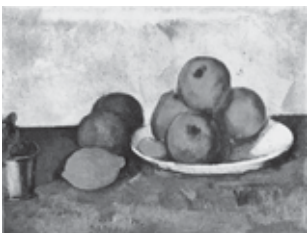
CÉZANNE. Natureza-morta com maçãs.