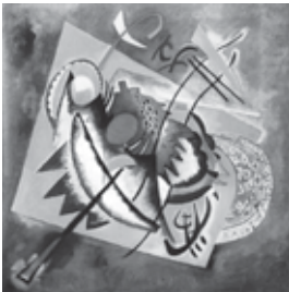
KANDINSKY. Oval vermelho.

Considerando o texto e os movimentos artísticos do século XX representados pelas obras a seguir, as características da arte abstrata estão presentes na obra