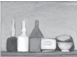
MORANDI. Still life.