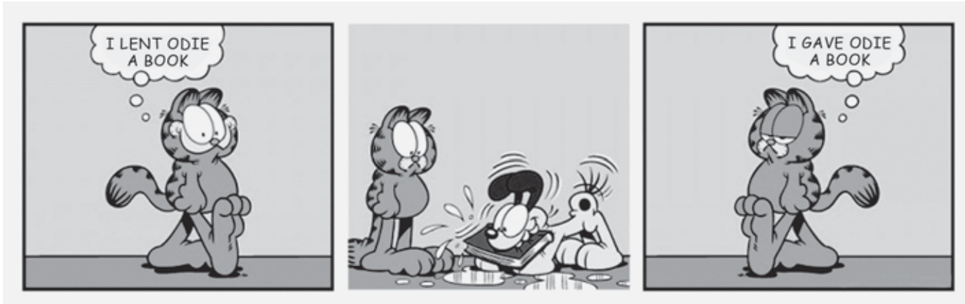
DAVIS, J. Disponível em: http://garfield.com . Acesso em: 20 jul. 2014.

Ao verificar o estado do livro emprestado ao cachorro Odie, o gato Garfield decide