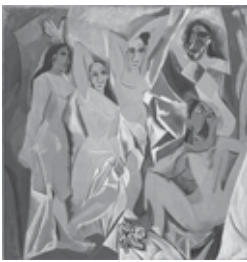
PICASSO. Les demoiselles d'Avignon.