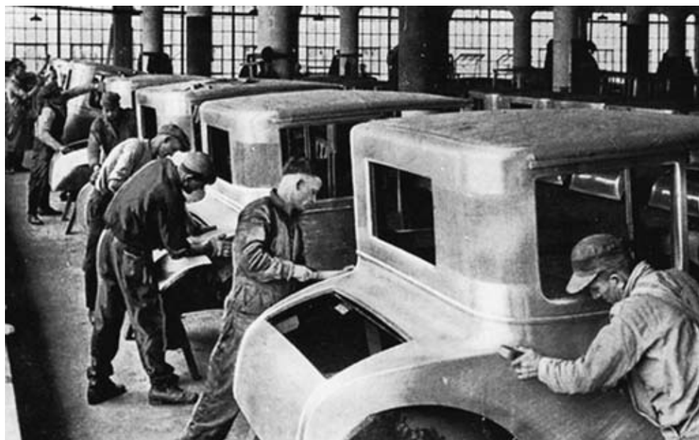
Figura 1 – Fabricação de automóveis em 1927

Disponível em: www.thedailybeast.com . Acesso em: 8 dez. 2012.