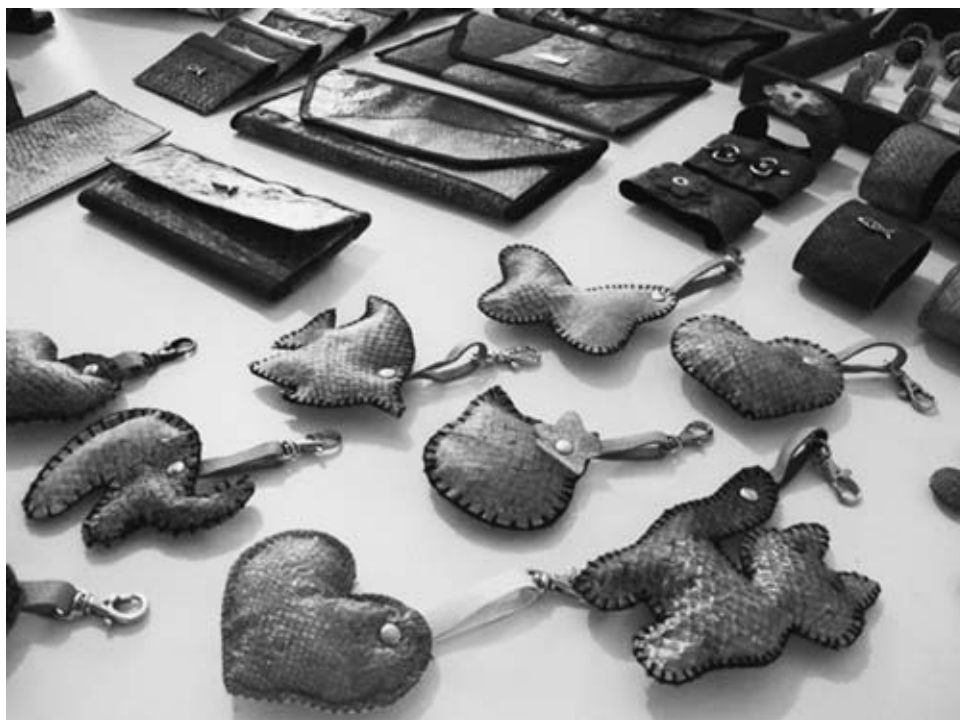
ROSSI, M. Produtos feitos com o couro de peixe em Guarujá, SP. Disponível em: http://g1.globo.com . Acesso em: 4 set. 2014.

Qualquer tipo de pele de peixe vira artesanato na mão de um biólogo do litoral de São Paulo. Ele criou um método mais natural de transformar a fina camada de pele em couro de peixe. Assim, ele retira do meio ambiente um material que seria jogado no lixo e inventa novas peças como bolsas, chaveiros e anéis, como os objetos apresentados na imagem.