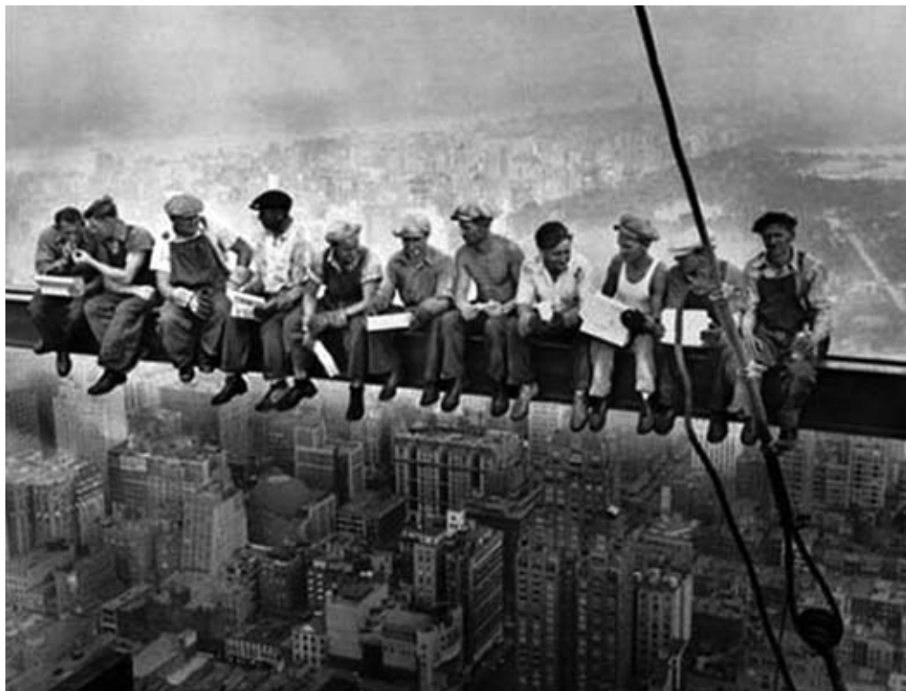
Nova York, 1932.