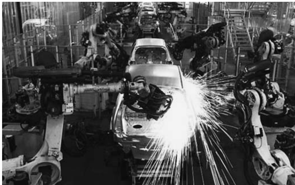
Figura 2 – Fabricação de automóveis em 2012

Disponível em: http://revistacrescer.globo.com . Acesso em: 7 ago. 2014.